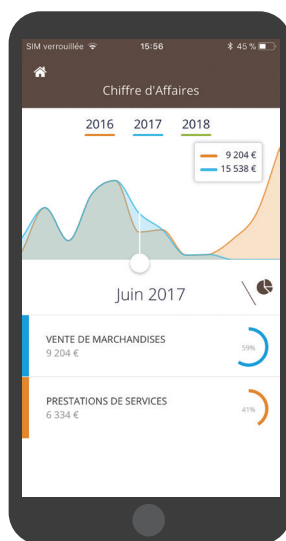
Aperçu en version mobile